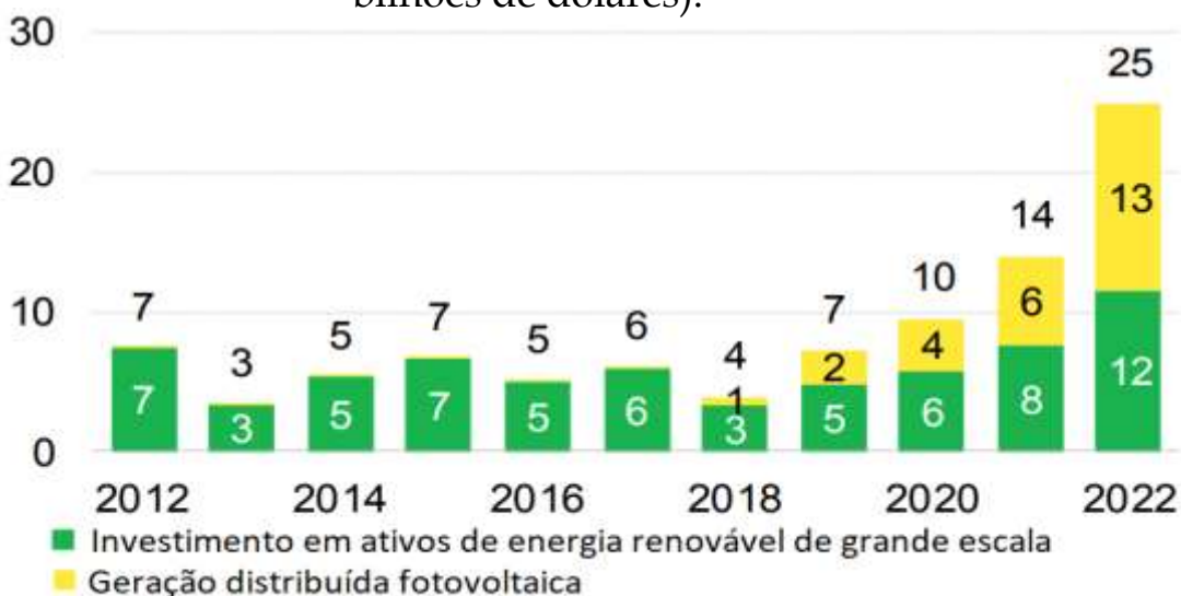
Gráfico 1 – Investimentos em energia renovável no Brasil por porte (em bilhões de dólares).

No que diz respeito aos investimentos, uma análise conduzida pela Bloomberg New Finance (BNEF) indicou que a GD proveniente de energia solar fotovoltaica se destaca como o mercado que mais atrai investimentos na transição energética no Brasil. Conforme ilustrado na Figura 1, o segmento referente a sistemas de energia solar de pequeno porte destinados ao consumo residencial, comercial e rural, registrou aporte de US$ 13,4 bilhões somente em 2022. Caso o Brasil mantenha essa trajetória proeminente na GD fotovoltaica, a pesquisa sugere que essa modalidade se tornará a principal fonte de geração elétrica do país até 2050, representando 30% da matriz, superando as grandes hidrelétricas.